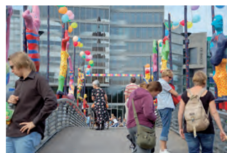
Die Skulpturen auf der Brücke