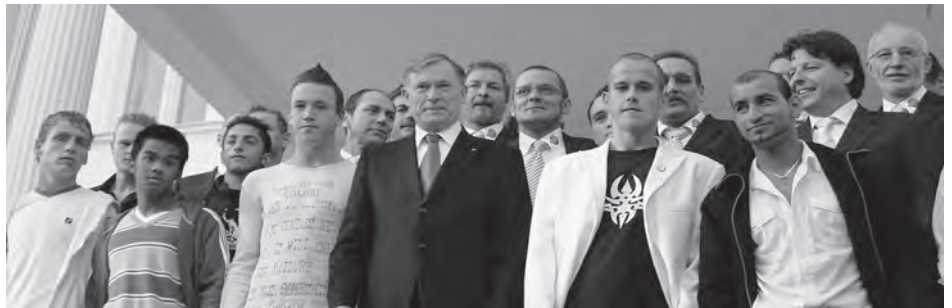
Bundespräsident Horst Köhler und das deutsche Team

Die WM selber startete mit einer spektakulären Eröffnungsfeier am 27. August 2006, an der 12.000 Zuschauer teilnahmen, um die 16 Nationalmannschaften gebührend zu empfangen. Zwar fehlten die Mannschaften aus Brasilien, England und den Niederlanden zum Einmarsch, aber das tat der Stimmung keinen Abbruch. Dafür