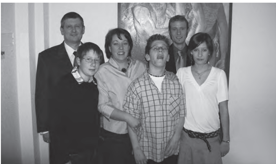
Die Familie Kindler

Meine Eltern? Sie sind eigentlich zu bewundern, sie bringen irgendwie immer die nötige Kraft auf, um auch schwierige Zeiten zu überstehen. Ich muss mir jedoch selbst eingestehen, dass ich mich in solchen Zeiten schon einmal aus dem Staub gemacht habe, weil ich nicht immer diese Ausdauer und dieses Verständnis parat hatte. Der Alltag mit meinem Bruder war zwar sehr erfüllt, aber auch schwierig zu meistern, da Probleme zu lösen Tag für Tag weitere Aufgaben waren. Hatte man eins bewältigt, kündigte sich schon das nächste an. Man könnte von einem Marathon reden, der nicht nur 42 km lang ist, sondern das ganze Leben andauert. Auf diesem Weg kommt man manchmal durch Unwetter und Wirbelstürme, dann verschwinden die Wolken aber auch wieder und die Sonne scheint fröhlich vor sich hin. Ich finde man kann bei so etwas nicht die Augen schließen und so tun, als ob es einen nicht betrifft. Aber es betrifft jeden, der in dieser Welt lebt und jeder sollte sich so einer Verantwortung stellen, auch wenn es nicht immer leicht ist. Aber mittlerweile weiß ich, dass mit Überzeugung alles zu schaffen ist.