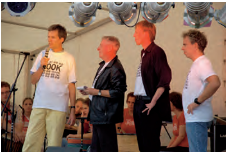
Die Organisatoren des Festivals

Ein Musik- und Theaterfestival, gestaltet von Menschen mit Behinderung auf hohem Niveau und mit großem Erfolg, lockte zahlreiche Besucherinnen und Besucher mit und ohne Behinderung am Samstag, 2. September 2006, in den Kölner MediaPark.