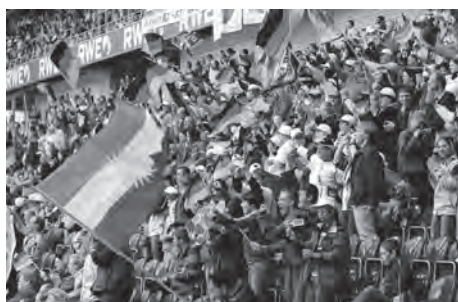
Die Fans jubeln

ballfan begeistert. Von einem spannenden „Unentschieden“ bis hin zu haushohen Siegen – alles war dabei. Jede Mannschaft zeigte sich von ihrer besten Seite: Australien, Bosnien-Herzegowina, Deutschland, England, Frankreich, Japan, Mexiko, Niederlande, Nordirland, Polen, Portugal, Russland, Saudi-Arabien, Südafrika, Südkorea und Ungarn. Sie alle wurden gefeiert und bejubelt.