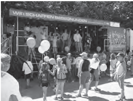
Der WM-Truck macht in Köln Station

Die WM der Menschen mit Behinderung wurde von einer öffentlichkeitswirksamen Kampagne im Vorfeld begleitet. In Köln machte dazu am 3. Juli der „WM-Truck“ Station: Die Hauptattraktion war der Human-Table-Soccer, ein Kicker-Spiel, in dem die Menschen die Figuren darstellten.